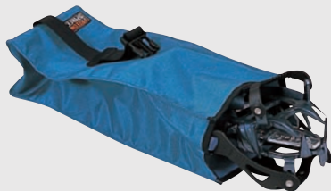
アイゼンケース袋型 CG-406 ¥1,365 (本体価格¥1,300)

リストバンドタイプ ■素材: ナイロン ■サイズ: 15mm×83cm ■カラー: ■ブルー ■重量: 18g