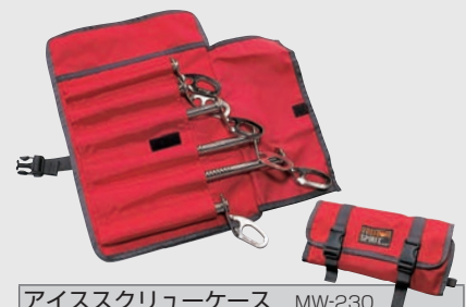
アイススクルーケース MW-230 ¥2,940 (本体価格¥2,800)

■素材: ナイロン210Dn リップストップ ■サイズ: (縦×横×厚さ 適応全長): S / 80×26×13cm 65cm まで M / 90×28×13cm 80cm まで L / 100×30×13cm 93cm まで ■カラー: ■ブラック ■オレンジ ■重量: S=230g M=250g L=310g