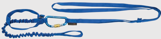
ピッケルバンド・ショルダーII CG-411 ¥1,890 (本体価格¥1,800)

リベット固定式 ■素材: ナイロン ■サイズ: 15mm×130cm テープ ■重量: 100g