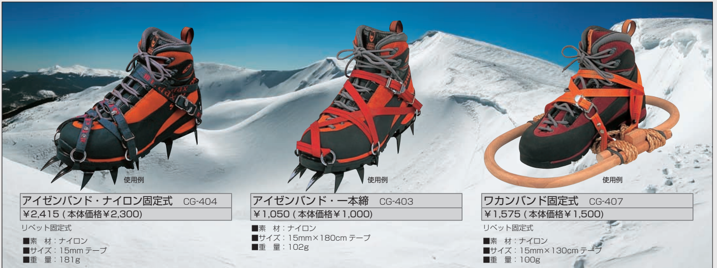
アイゼンバンド・ナイロン固定式 CG-404 ¥2,415 (本体価格¥2,300)

リベット固定式 ■素材: ナイロン ■サイズ: 15mm テープ ■重量: 181g