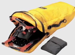
スノーシューケース MW-220 S ¥3,360 (本体価格¥3,200)

M ¥3,675 (本体価格¥3,500) L ¥3,990 (本体価格¥3,800)