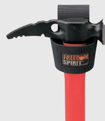
ハンマーホルスター CG-203 ¥840 (本体価格¥800)

本体後側にマジックテープを使用している為、ハーネスへの着脱が容易です。 ■素材: ナイロン ■カラー: ■ブラック ■重量: 33g